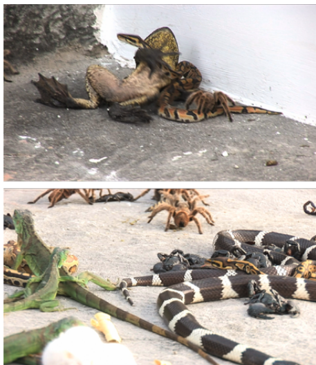
Usine , 2008 (Projection vidéo)

Étienne Balibar développe depuis plusieurs années l'hypothèse d'une « phénoménologie de la cruauté » pour rendre compte de la violence extrême : celle de la destruction des corps dans le génocide et de l'effraction dans le corps d'un sujet 8 . La perception de la cruauté serait de l'ordre de l'irrationnel, empêchant la conceptualisation et mettant au défi les sciences sociales, et ne pourrait par conséquent trouver sa pleine expression que dans l'image littéraire ou iconique. En représentant des cadavres, Abdessemed réussit parfaitement à mettre en scène cette cruauté et à faire prendre conscience au spectateur de la part d'irrationalité de l'acte violent. Comme pour montrer la violence la plus élémentaire, l'artiste représente abondamment la souffrance animale. Son œuvre fait d'ailleurs scandale chez les défenseurs de la cause. À une époque où il est devenu tabou de tuer un animal pour les besoins d'un film, Abdessemed présente une vidéo intitulée Usine (2008) dans laquelle des animaux sauvages et domestiques s'entretuent. Grenouilles, scorpions, serpents, volailles et chiens se battent pour former une vision féroce et perverse de la chaîne alimentaire.