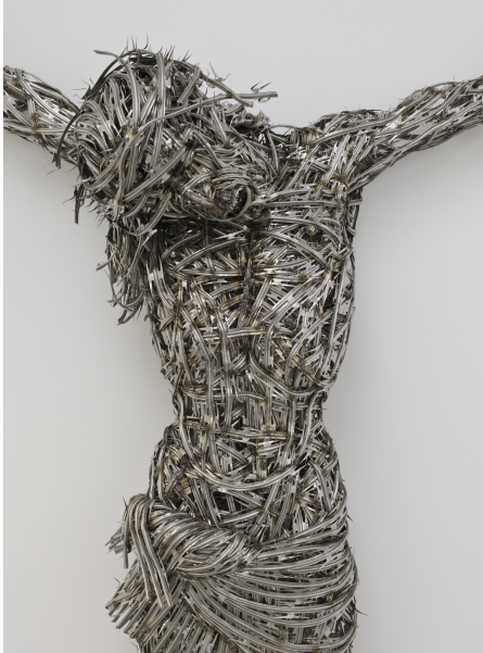
Décor 2011-2012 (Fil de fer, rasoirs) Collection François Pinault Courtesy de l'artiste et de David Zwirner, New York/London

Le fil de fer barbelé, déjà présent dans Wall Drawing (2006), neuf cercles accrochés en série, est réemployé de manière plus radicale dans Décor (2011-2012). Cette pièce, cœur de l'exposition, est constituée de quatre Christs crucifiés apparaissant presque à taille réelle et en ronde bosse grâce au façonnage du métal. L'artiste a fait draper ce fil enrichi de lames de rasoir pour obtenir un relief assez grossier mais terriblement évocateur. Ces lames tressées en bouquet sont les signes d'un sang absent. Du coup de tête de Zidane à la Crucifixion, Abdessemed délaisse la chronologie et la situation pour mettre en scène un drame de la mythologie collective, que celle-ci soit religieuse, sociale ou sportive.