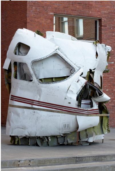
Bourek , 2005 (Fuselage d'un avion Aerojet Commander, 226 x 274 cm)

Mais la mise en scène de la violence perd de sa force en s'inscrivant trop lourdement dans l'histoire des arts plastiques depuis soixante ans : la nudité, la vidéo, le déchet et le ready-made . Comment ne pas voir dans ces carcasses de voitures calcinées sculptées en céramique des réécritures à la fois violentes et sages des explosions de voiture pratiquées par Arman ? Et dans les carlingues d'avion, Bourek (2005) et de Telle mère tel fils (2008), l'héritage de César ? Abdessemed leur ajoute la référence vague et pourtant omniprésente à des émeutes de banlieue ou à des catastrophes aériennes, ainsi que la douceur maternelle d'un titre ironique.