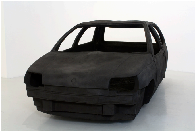
Practice Zero Tolerance , 2006 (Terre cuite 440 x 140 x 140 cm) Collection privée © Adel Abdessemed, ADAGP Paris 2012

Sarkozy, alors ministre de l'Intérieur, sur la « tolérance zéro » dans les banlieues après les émeutes de 2005.